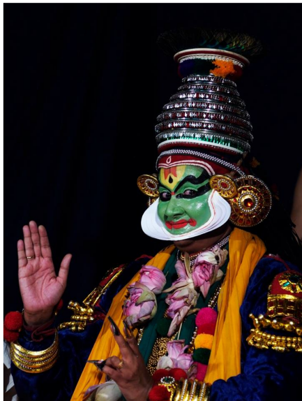
Kathakali & Chakyarkoothu by Sopanam temple arts Canada Kathakali Kirmeera Vadham "Sree Krishnan & Sudarshana Chakram"

Prathishta Dinam Mahotsavam June 12, Saturday